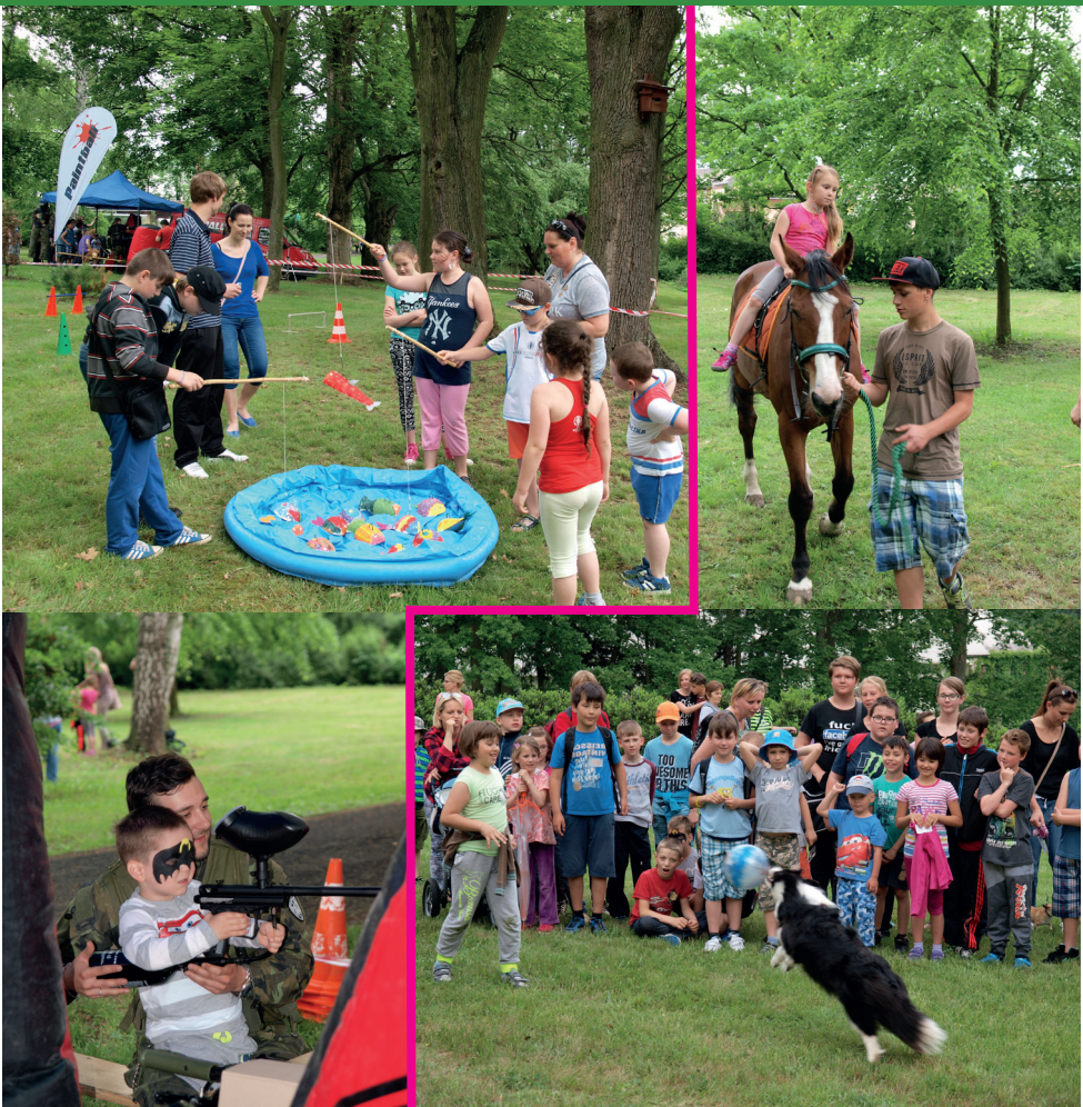
Dětský den v zámeckém parku 4.6. 2016; více na str. 4..